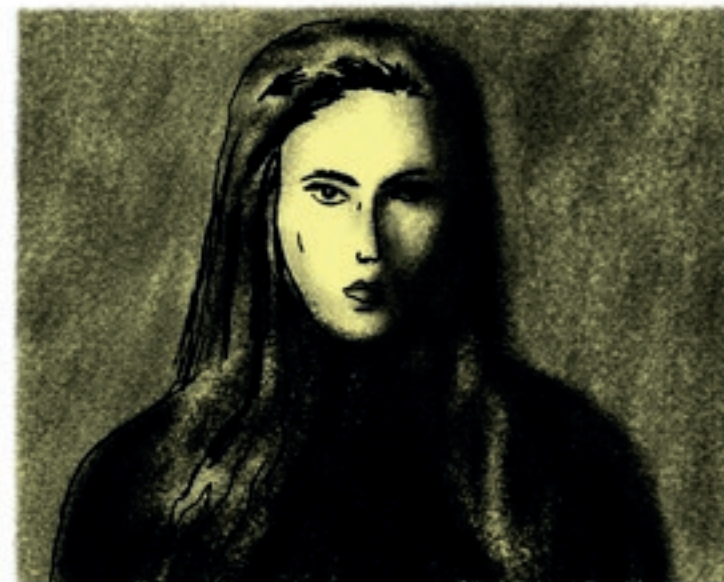
A) Nasvícení šikmo shora pracuje se světlem a stínem.