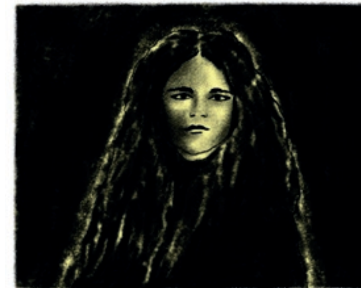
D) Nasvícení protisvětlem je tajemné a dramatické.