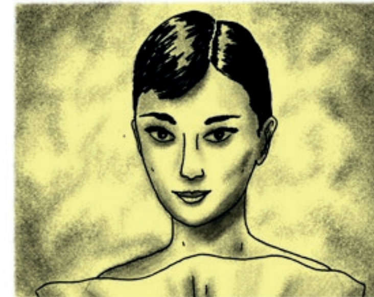
B) Klasické „hollywoodské“ svícení zepředu shora zvýrazňuje rysy tváře.