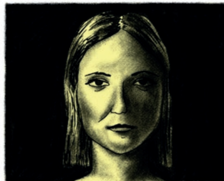
C) Svícení z boku z úrovně tváře vyvolává dojem, jako by model seděl u okna.